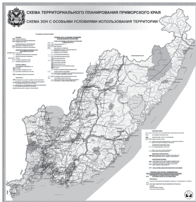
Приложение № 3 к постановлению Администрации Приморского края от 30 ноября 2009 г. № 323-па