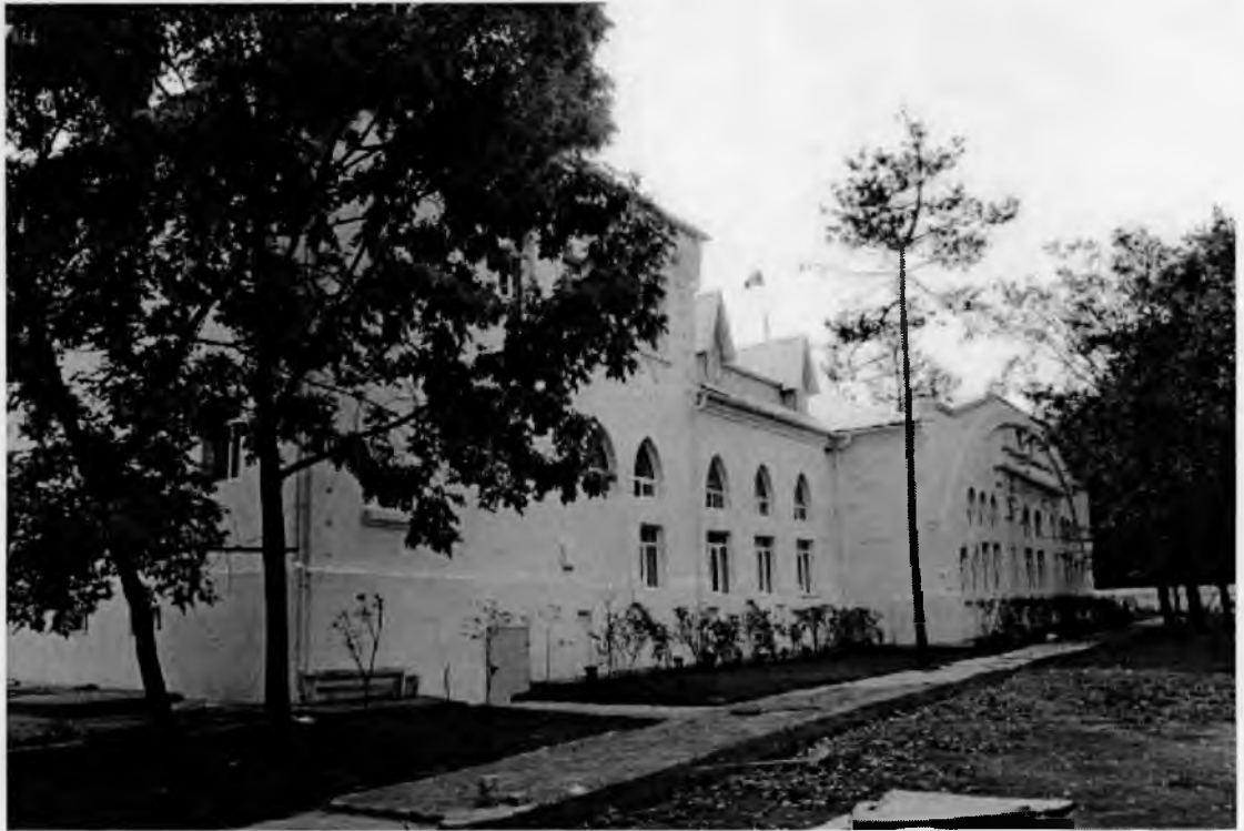
Рис. 5. Северный фасад здания, 30.09.2015