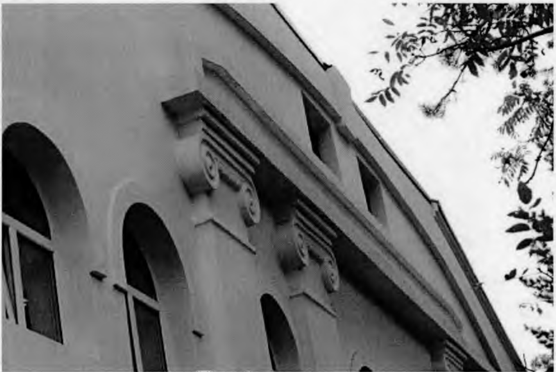
Рис. 8. Детали северного фасада, 30.09.2015