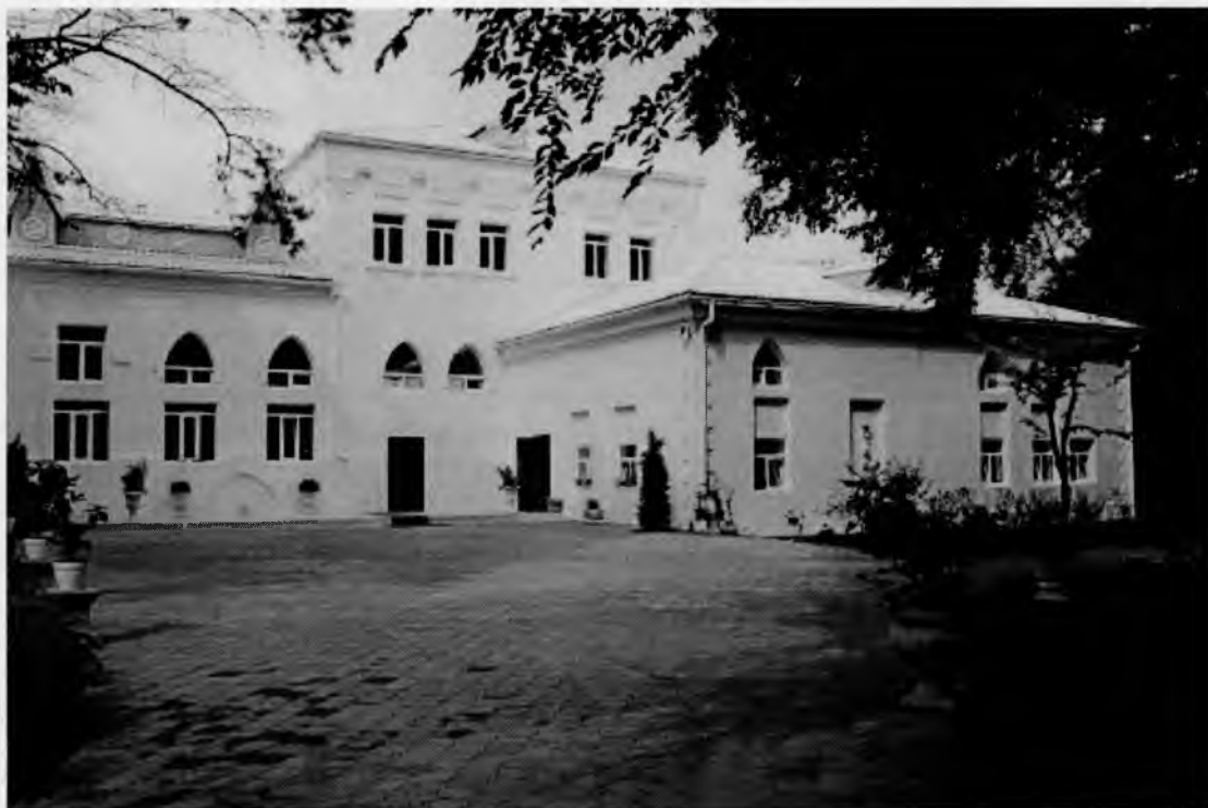
Рис. 2. Южный фасад здания, 30.09.2015