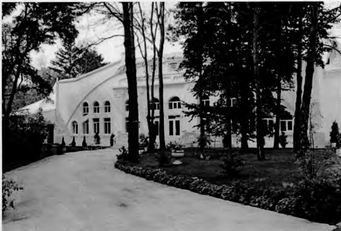
Рис. 1. Главный южный фасад здания, 30.09.2015