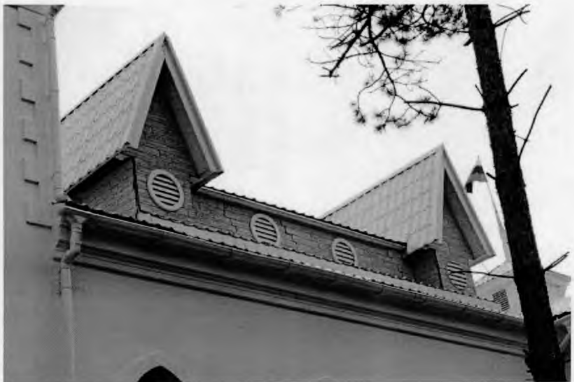
Рис. 6. ,Детали кровли. 30.09.2015