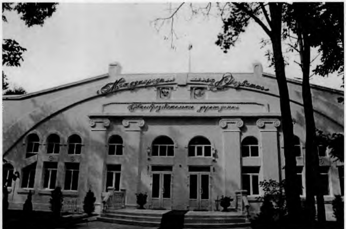
Рис. 10. Главный фасад здания. Современный облик, 30.09.2015