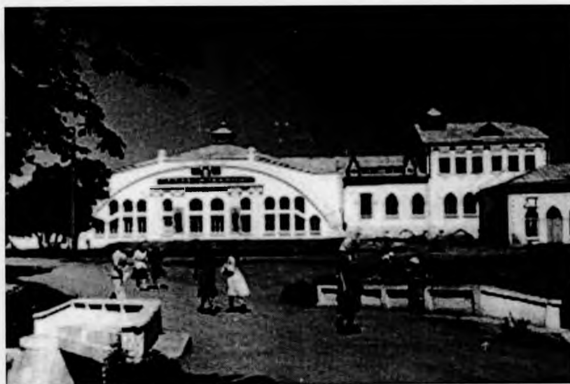
Рис. 12. , фото 1951 г.