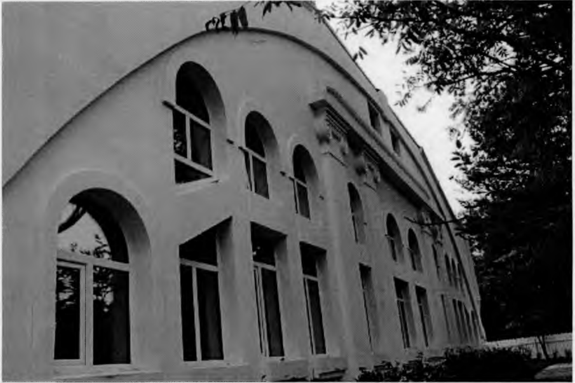
Рис. 7. Северный фасад здания, 30.09.2015