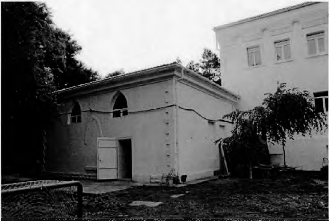
Рис. 4. Восточный фасад здания, 30.09.2015