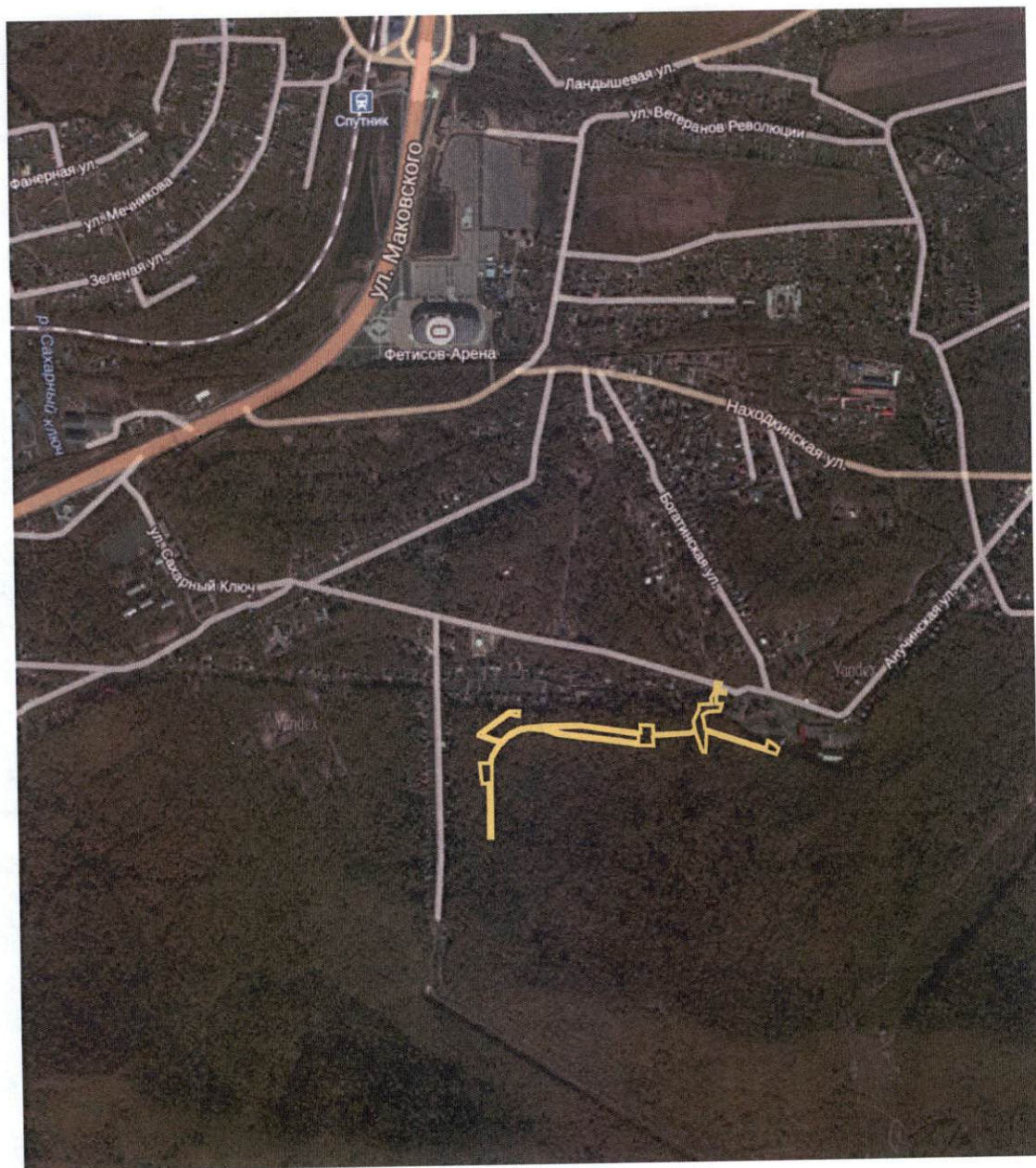
Схема территории в районе улицы Калиновой, 24 в городе Владивостоке