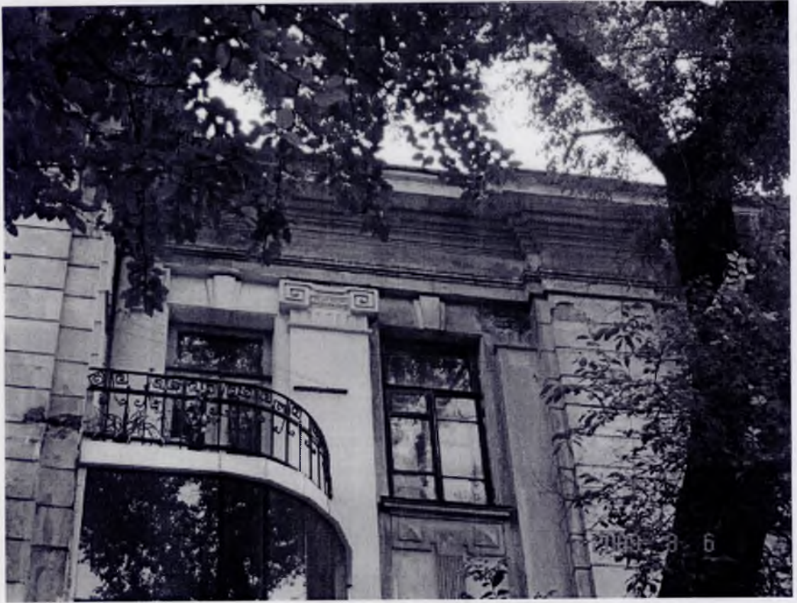
Рис. 1. , 06.08.2009