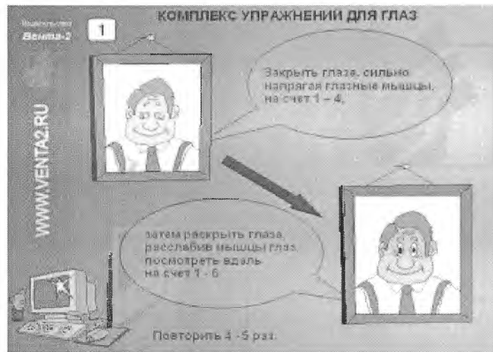
Рис.1. Комплекс упражнений для глаз

влечет дополнительную нагрузку на глаза оператора и вызывает преждевременную усталость. На рис.1 изображен комплекс упражнения для глаз.