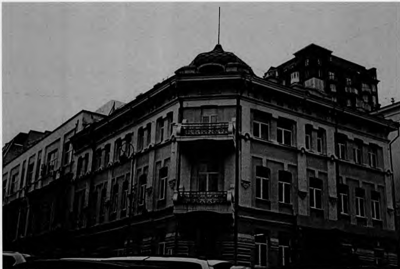
Главный фасад здания по Океанский пр-т, д. 24