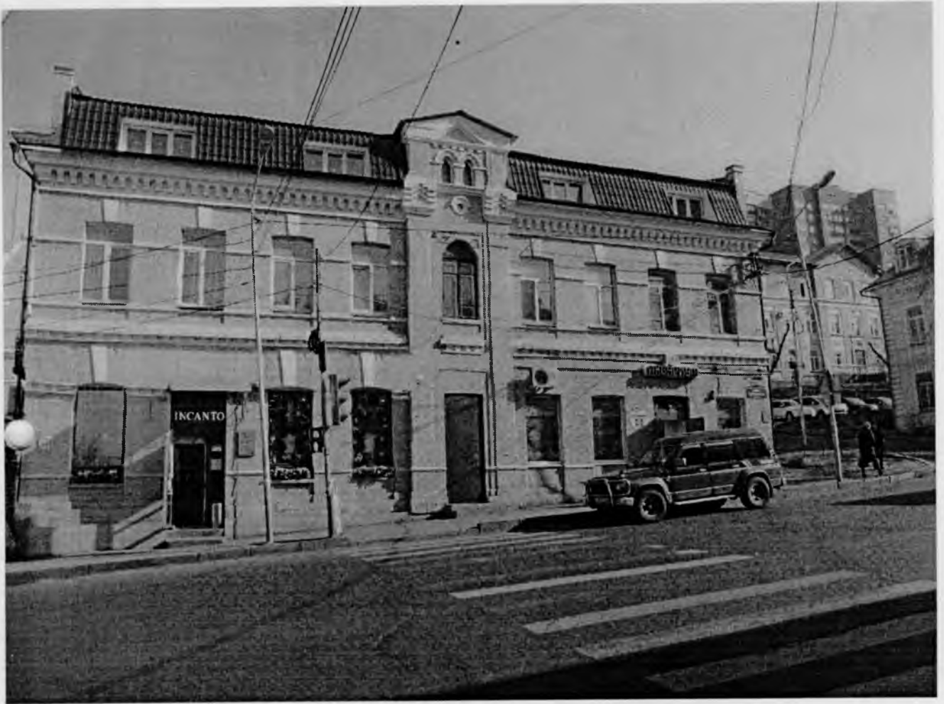
Главный фасад здания по ул. Светланская, 177