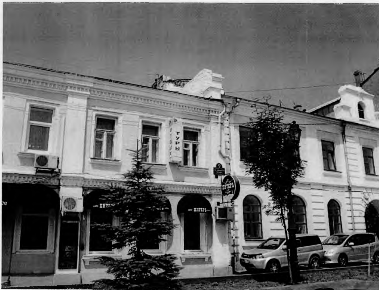
Главный фасад здания по ул. Адмирала Фокина, д. 9