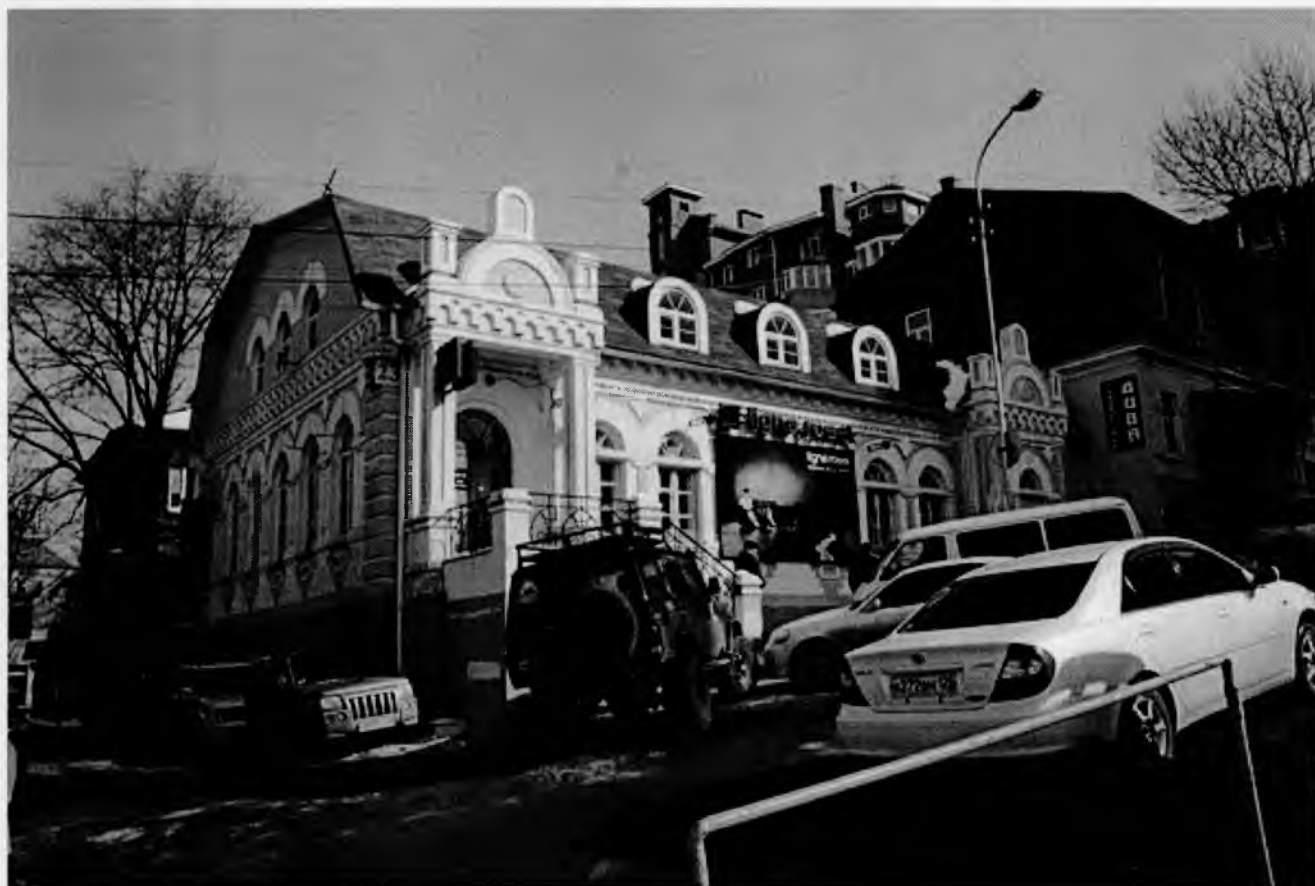
Главный фасад здания по ул. Прапорщика Комарова, д 23а