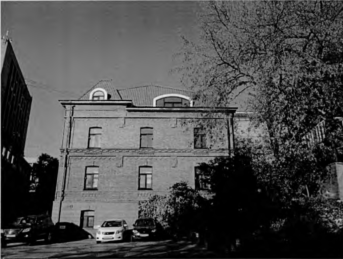
Западный и северный фасад здания