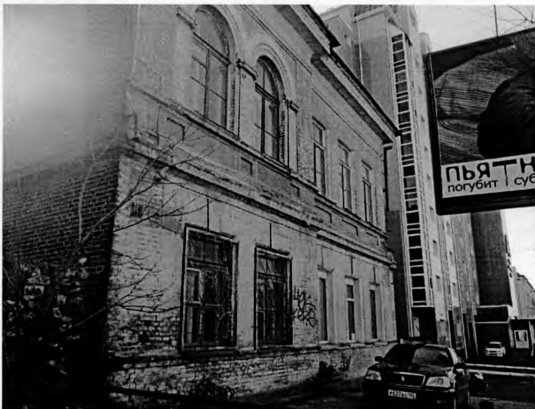
Главный фасад здания по ул. Уборевича, 36