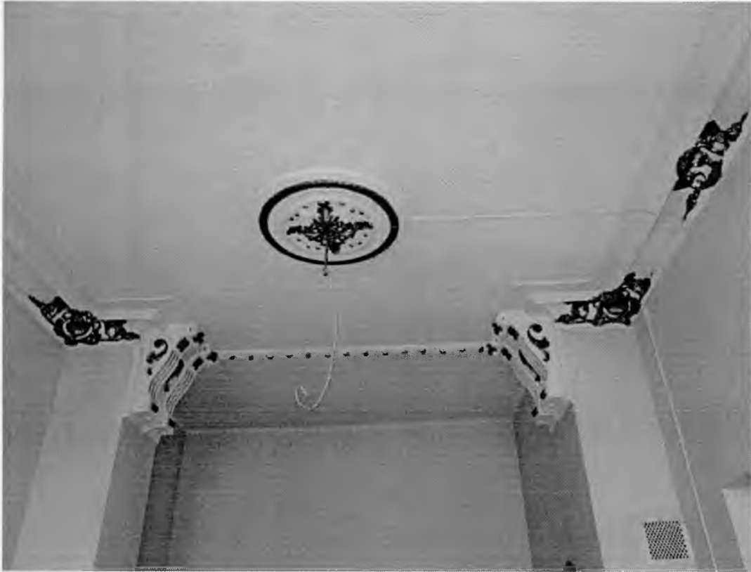
Интерьер лестничной площадки