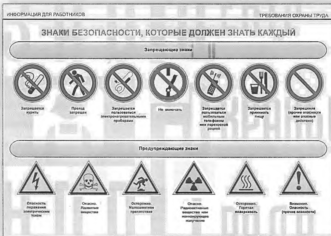
Рис. 4. Основные запрещающие и предупреждающие знаки

низко расположенные конструктивные элементы зданий и сооружений.