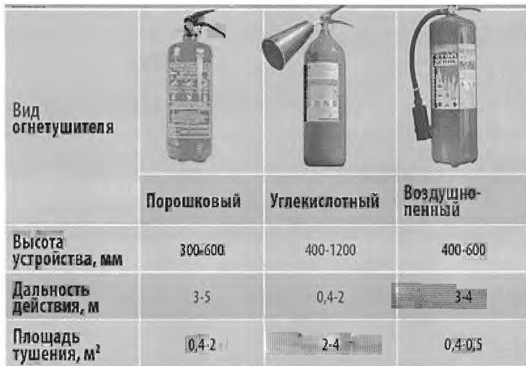
Рис. 6. Вид огнетушителя