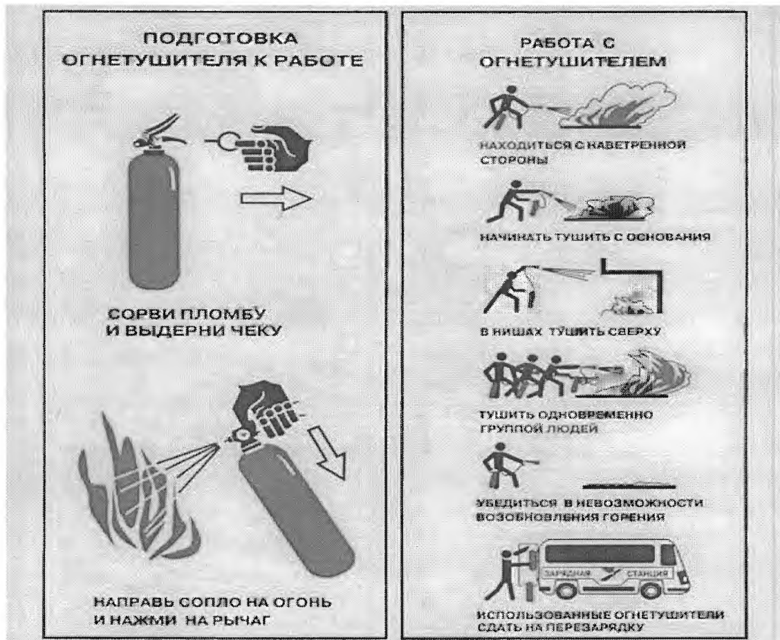
Рис. 5. Подготовка огнетушителя к работе и работа с ним

углекислотным или порошковым огнетушителем (рис. 6) или сухим способом (асбестовое одеяло, войлок, песок).