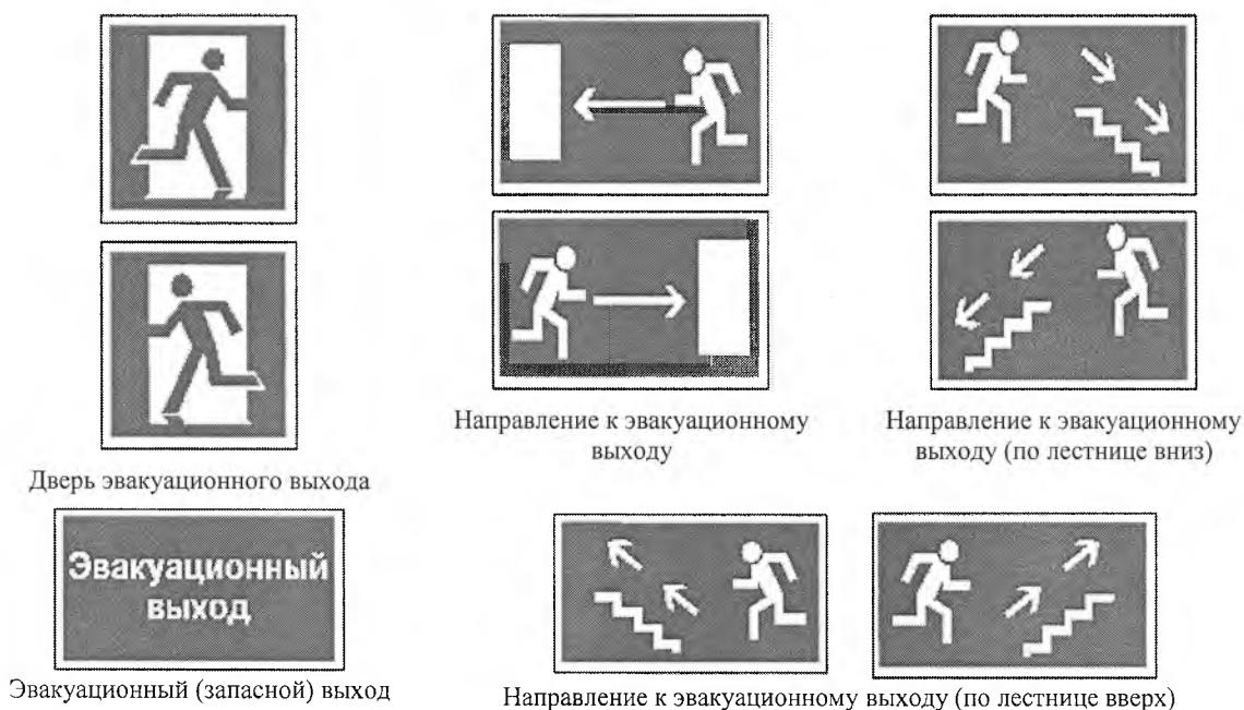
Дверь эвакуационного выхода