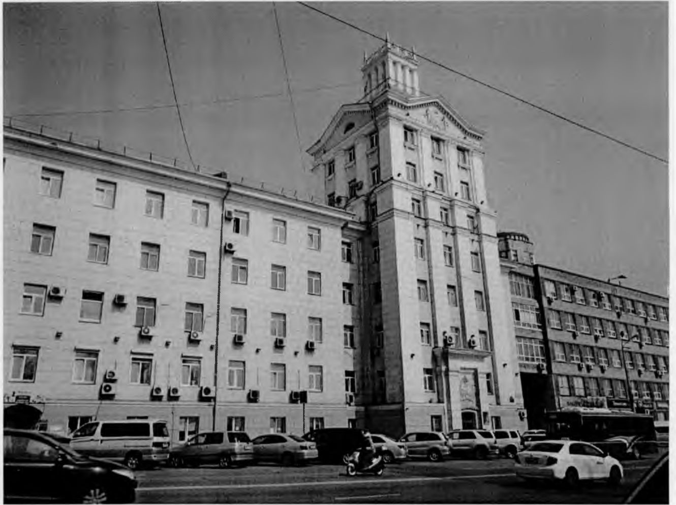
Главный фасад здания по ул. Суханова, 36