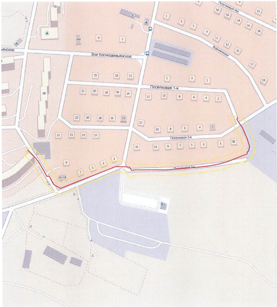
Схема территории, предназначенной для размещения объекта «Строительство кольцевого водопровода Д=300 мм для устройства водозаборных колонок по улице 2-я Поселковая в городе Владивостоке»